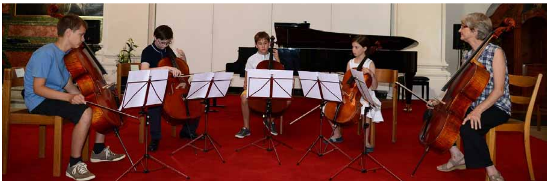
Un cours de violoncelle à l'Académie de musique Tibor Varga

Tous les détails sur www.electroziles.ch